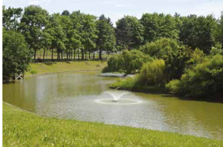
Le parc Jacques Duclos à 16 min* à pied de la résidence