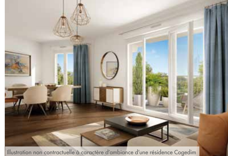
Illustration non contractuelle à caractère d'ambiance d'une résidence Cogedim

À la mesure de son architecture de standing, en harmonie avec son sublime cœur d'îlot, Le Domaine du Chevalier dévoile des appartements où règne une qualité de vie unique. Répartis sur 5 bâtiments, ils profitent d'une conception optimisée et de prestations soignées. Un confort de vie durable et plus économe en énergie est ainsi garanti.