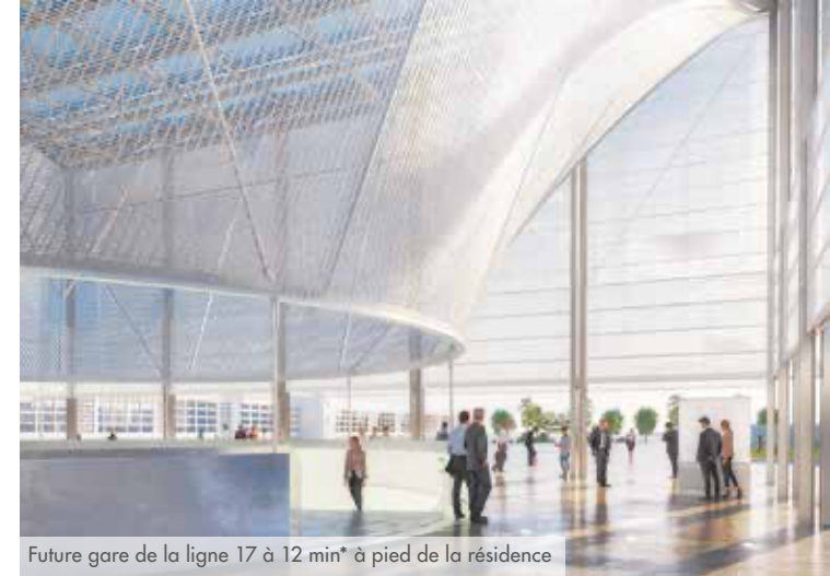
Future gare de la ligne 17 à 12 min* à pied de la résidence

Portée par l'arrivée de deux lignes du métro du Grand Paris Express*, Le Blanc-Mesnil gagne en attractivité. À seulement 7 km* de la Porte de la Villette, cette ville de la petite couronne parisienne est en plein essor. Elle redessine son territoire avec ambition tout en conservant les charmes de son patrimoine naturel. Le cadre de vie des Blanc-Mesnilois se veut attractifs, agréable à vivre et verdoyant au quotidien.