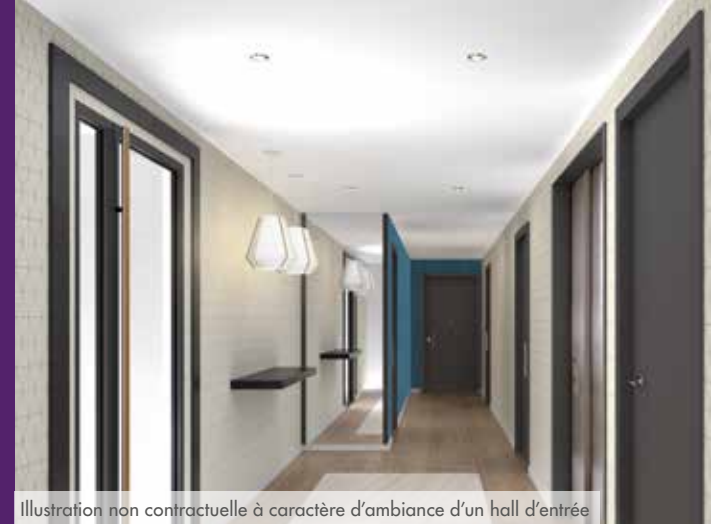
Illustration non contractuelle à caractère d'ambiance d'un hall d'entrée

« S'offrir un cadre de vie privilégié au sein d'une résidence au charme incomparable. »