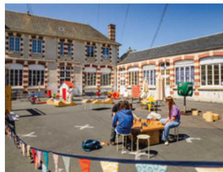
Une offre complète en matière d'éducation de la crèche au lycée