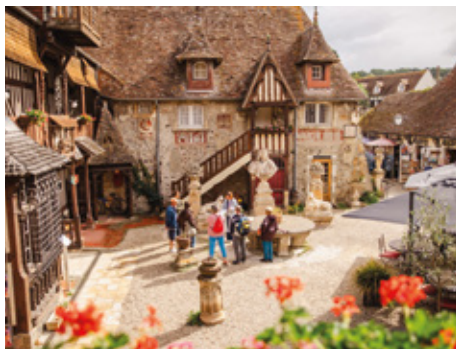
Artistes, restaurateurs, antiquaires et artisans se côtoient au Village d'Art Guillaume le Conquérant

À quelques pas, la mer offre tous les plaisirs nautiques depuis le port de plaisance et de nombreuses balades à vélo sur les sentiers côtiers et les marais de la Dives, idéal pour se reconnecter à la nature.