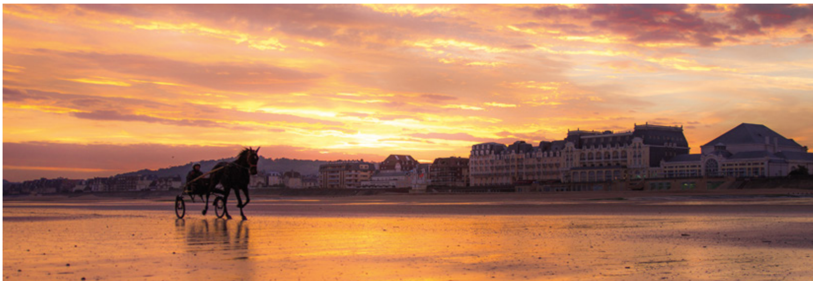
De nombreuses activités se pratiquent le long des 4 kilomètres* de plages de sable fin de Cabourg