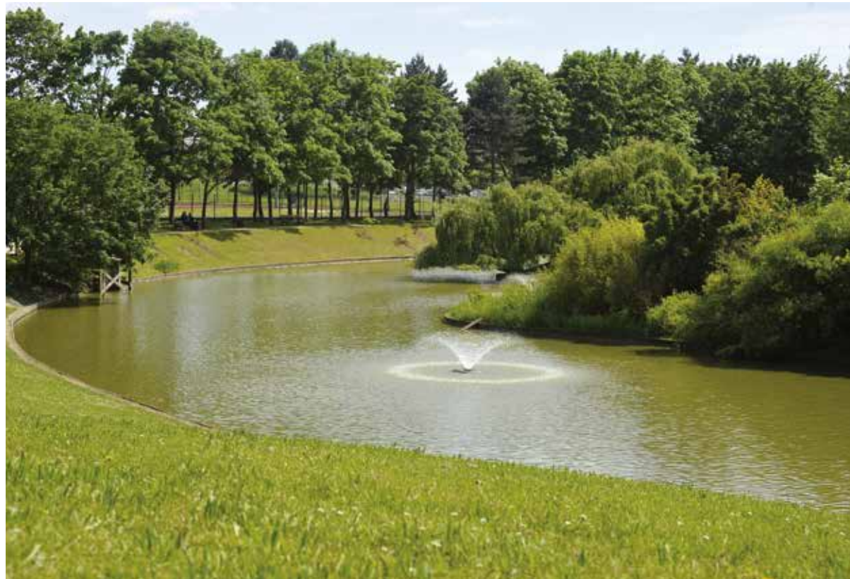
Le parc urbain face à la résidence

Proche d'axes routiers stratégiques comme l'A3 et l'A1, les habitants bénéficient aussi d'une offre de transports complète, grâce aux nombreuses lignes de bus, à la gare RER B et bientôt aux deux lignes 16 et 17 du métro du Grand Paris Express*.