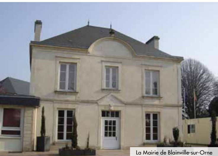
La Mairie de Blainville-sur-Orne