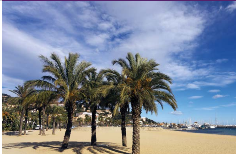
Plage centrale avec vue sur le port du Lavandou