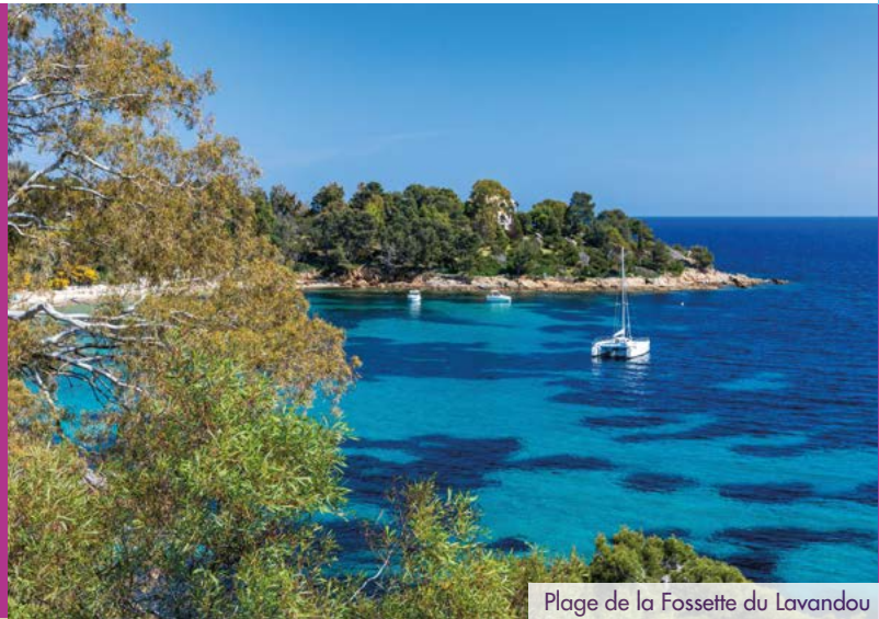
Plage de la Fossette du Lavandou