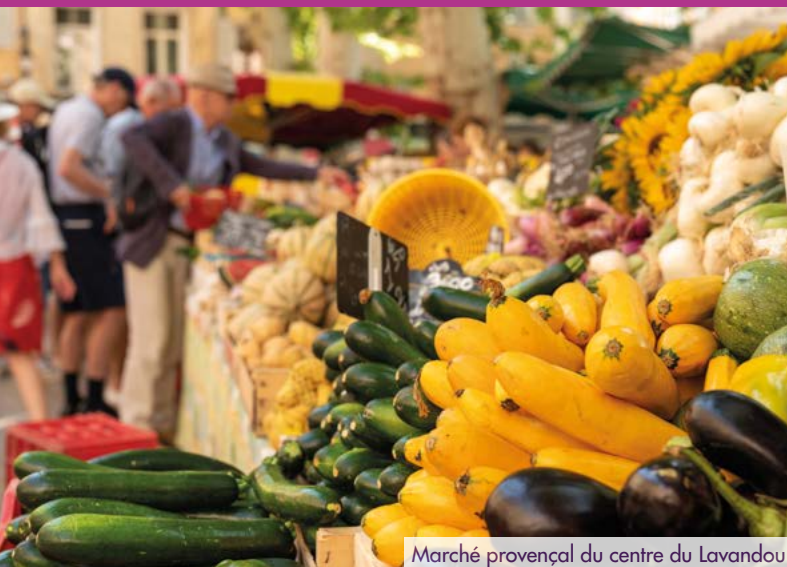
Marché provençal du centre du Lavandou